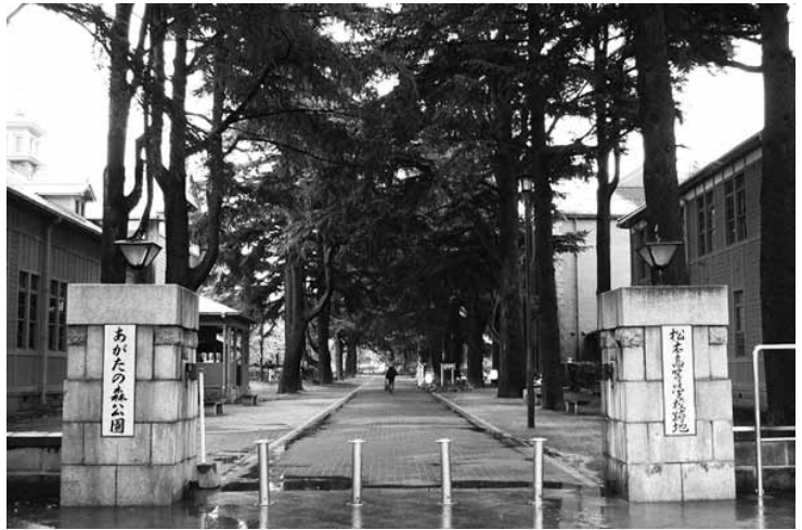
「あがたの森」入口。

楽」も同様。連句と出会って日の浅かった私は、祝意を込めるといふのは、こういうことなのだ」と学んだ。