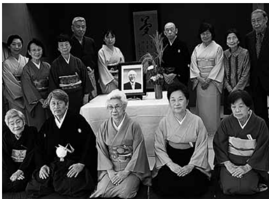
正式俳諧を終え、配役全員で明雅先生の遺影を囲む