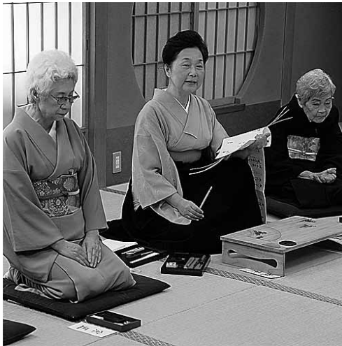
執筆（中央）が「文台捌き」を終えて歌膝に構え、付句を待つ