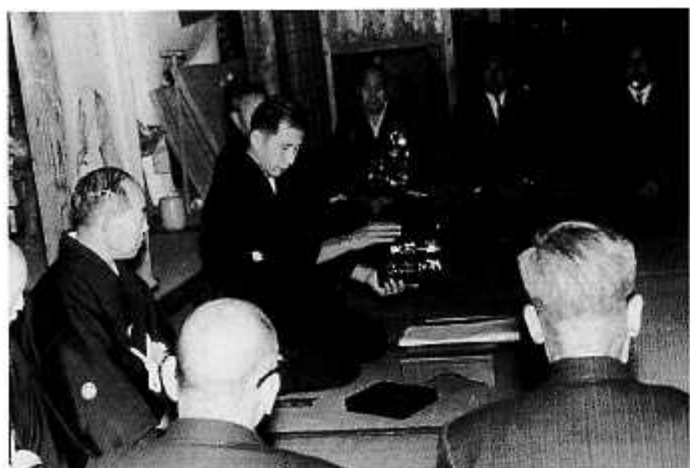
葛三 百五十年忌正式俳諧にて執筆をつとめる(昭和42年11月)