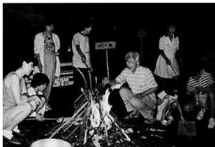
軽井沢でお孫さんたちに囲まれて(平成3年8月)