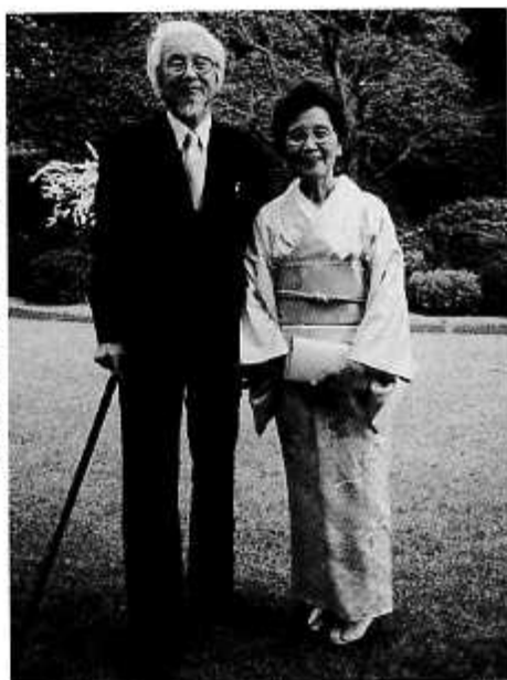
お孫さんの結婚式当日、国際文化会館にて (平成10年4月)