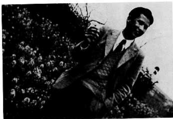
松本市城山にてお花見(昭和28年4月)