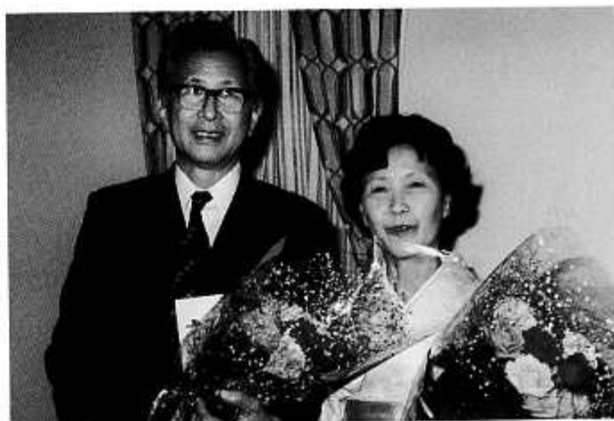
信州大学退官記念祝賀会にて(昭和55年5月)