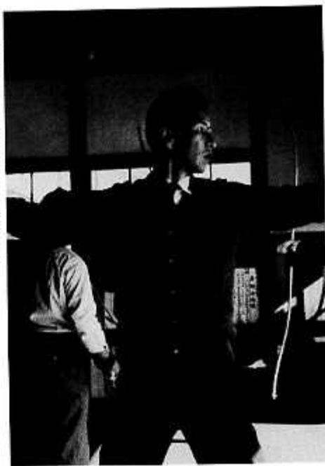
信州大学弓道場にて(昭和34年11月)