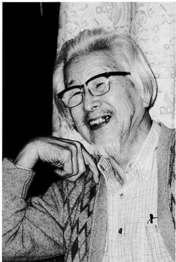
ご自宅にて(平成8年1月)