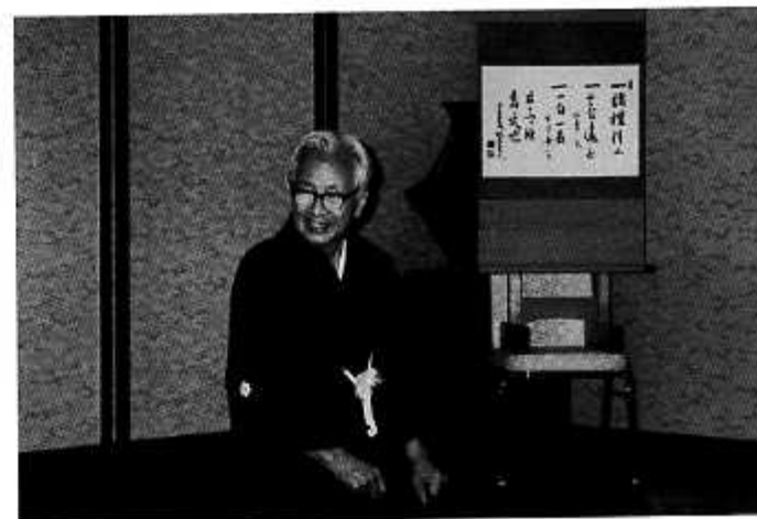
亀戸天神藤祭奉納正式俳諧にて(平成元年4月)