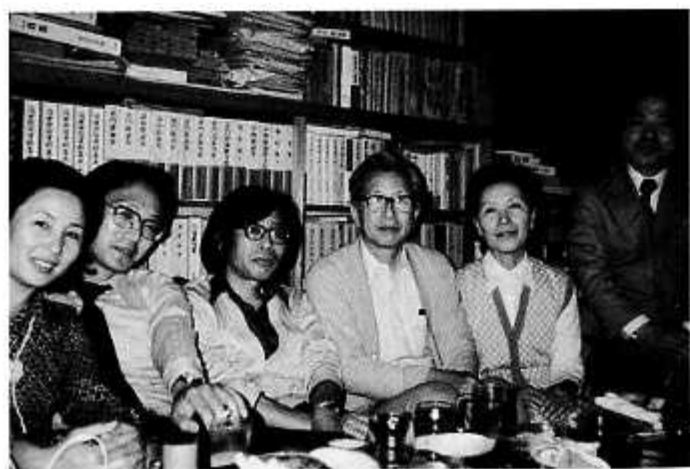
松本市のご自宅書斎で教え子たちと(昭和54年9月)